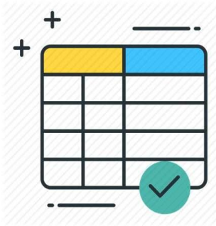
TABELA DE VALORES EM VIGOR EM 2022

Salário Mínimo.....R$ 1.212,00 (Portaria nº 1.021, de 30 de dezembro de 2020)